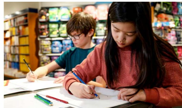
Mädchen und Junge beim Malen, Bild: BMK/Viktoria Miess