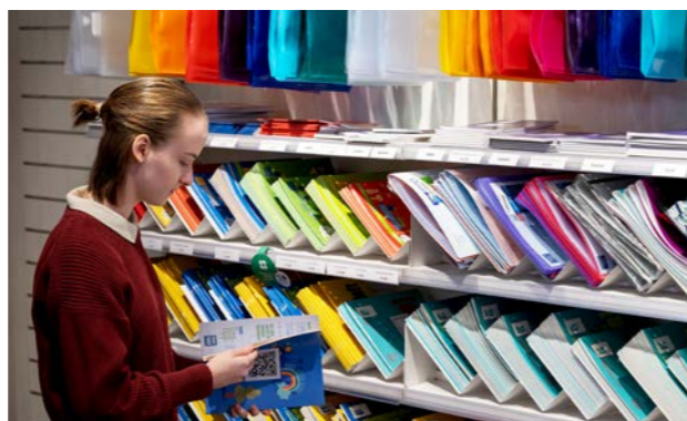
Mädchen bei der Produktauswahl