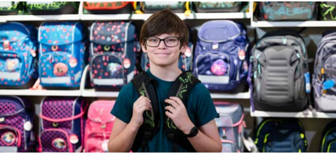
Junge mit Schulrucksack, Bild: BMK/Viktoria Miess